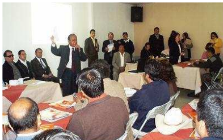
El gobernador de San Marcos, Francisco Mérida se dirige a los representantes del Consejo Departamental de Desarrollo (CODEDE)

During the meeting, the speech of the representative from the Peoples Council of San Marcos was supported by various mayors, ie. from Comitancillo, Ixchiguan, Tajumulco among others, and it was established that in the next meeting of the CODEDE in February, more time will be provided to cover these issues in depth. A suggestion was made to invite the 9 congress men from San Marcos to inform them and ask their support for the people's struggle in defense of their territory and its natural resources.