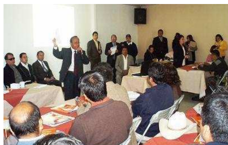
El gobernador de San Marcos, Francisco Mérida se dirige a los representantes del Consejo Departamental de Desarrollo (CODEDE)

En la reunión el discurso del representante del Consejo de los Pueblos fue apoyado por varios alcaldes, como los de Comintancillo, Ixchiguan, Tajumulco entre otros, y quedaron que en la próxima reunión del CODEDE, en Febrero, se dará más espacio para platicar del tema con más profundidad. También se sugirió invitar a los 9 diputados que tiene San Marcos en el Congreso para que se informen y apoyen a la lucha de los pueblos por la defensa del territorio y sus recursos naturales.