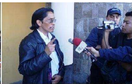
El vocero del Consejo de los Pueblos de San Marcos da declaraciones a la prensa local sobre el resultado de la reunión; reafirmando la necesidad de apoyo del CODEDE a la lucha del Consejo de los Pueblos de San Marcos