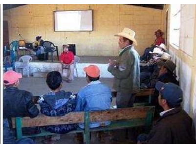
Lider comunitario pregunta sobre los datos del informe del monitoreo del agua

The mayoress of Canoj (Sipacapa) gives opinion during presentation on the Monitoring and Analysis of water around the Marlin mine.