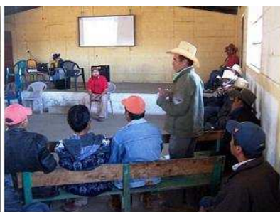
Lider comunitario pregunta sobre los datos del informe del monitoreo del agua