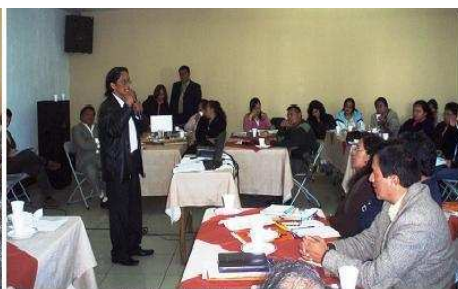
El representante del Consejo de los Pueblos de San Marcos explica la necesidad y pide el apoyo para declarar al Departamento de San Marcos libre de minería