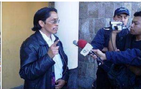
El vocero del Consejo de los Pueblos de San Marcos da declaraciones a la prensa local sobre el resultado de la reunión, reafirmando la necesidad de apoyo del CODEDE a la lucha del Consejo de los Pueblos de San Marcos

The representative of CPSM explains the importance and necessity of declaring San Marcos free of mining and asks for support.