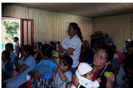
La alcaldesa de la comunidad Canoj (Sipacapa) opina durante presentación del informe del monitoreo del agua alrededor de la Mina Marlin

Los talleres finalizaron con la presentación de un video “Mesoamérica en Movimiento” en el cual se exponen las luchas regionales y se evidencia que los problemas son los mismos, pero sobre todo que en diversas partes de Centroamérica hay personas luchando por su libertad y dignidad. Como dijo un anciano “es bueno saber que no somos los únicos que estamos luchando contra las transnacionales, deberíamos de unirnos, porque hay un dicho que dice, la unión hace la fuerza, si trabajamos todos unidos lograremos sacarlas, esta es nuestra tierra, no la de ellos”