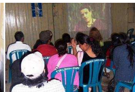
Vecinos de las comunidades de Sipacapa ven un video sobre la minería química de metales